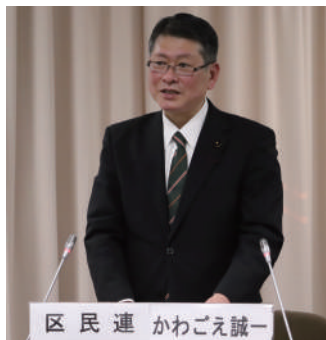
総括質疑で質問をするかわごえ

学校教育担当部長： 私立学童は小学校施設の利用を考慮しており、子どもが集団で密集状態にならないようにする。